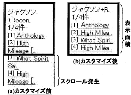
図 3: 機種ごとのカスタマイズの効果

そこで、クライアントが送信する機種情報を、サーバ側で取得し、機種ごとに操作回数保証型検索方法の「最大メニュー幅」を変える。また、表示する検索結果ページの各行を、機種ごとの「一行の表示文字数の最大値」を上限として切り捨てる。この切り捨ては、CD の検索結果のアーティスト名やタイトル名のように、文字列の先頭の一部さえ表示すれば、その文字列が示しているものをたいてい想像できるという特徴を利用している。これにより、クライアントの表示環境が異なる場合にも、数回の最大絞込み回数以内で、必ず検索結果を一画面に収めることが可能となる(図 3(b))。